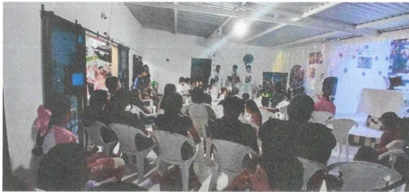
Novenas de Navidad

Actividades realizadas: entrega de regalos, ropa y refrigerios en el marco de las novenas navideñas.