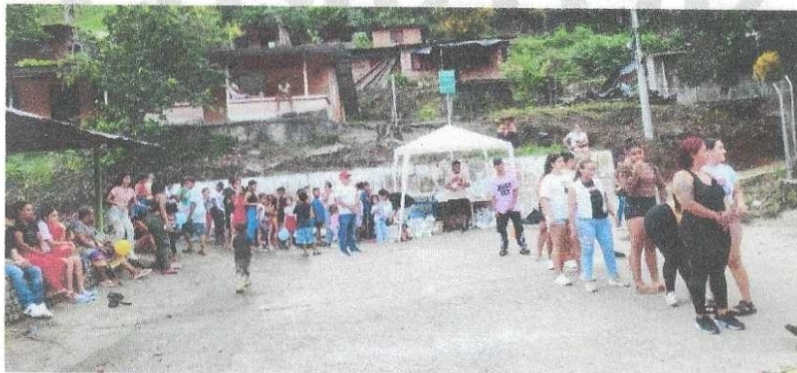
Jornada recreativa con nuestra comunidad

Valores y Principios Institucionales: Los valores institucionales constituyen el fundamento ético y espiritual que orienta la toma de decisiones, la formulación de programas y la relación con beneficiarios, aliados y donantes: Amor: Solidaridad: Compasión, Bien Común, Empatía, Fe, Buena Fe: Rectitud, honestidad y Transparencia.