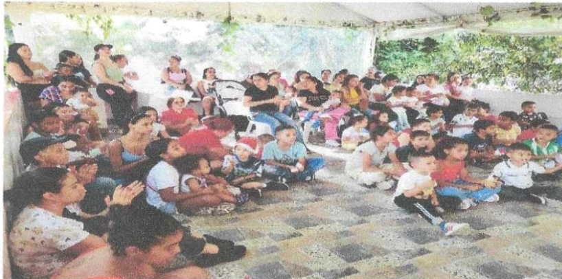
Novenas de Navidad

Impacto: fortalecimiento del tejido social y promoción de valores familiares en población vulnerable.